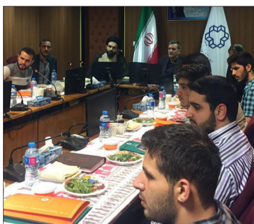
افطاری دکتر خاکی صدیق با دانشجویان غیر ایرانی